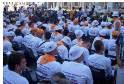
A magyarok színe a narancssárga volt

Görögkatolikus egyházunk jóvoltából nagy élményben lehetett részünk augusztus 1-7-ig, mivel Rómába, az örök városba zarándokoltunk. Szép élményekkel, bőséges ismeretekkel és gazdag lelki adományokkal tértünk haza. Magyarország keleti részéből 4 busz indult, mintegy 170 ministráns fiú részvételével.