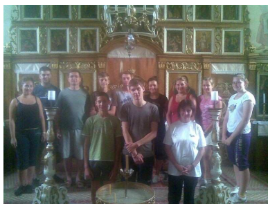
Az irotai templomban

„Az életednek van egy titkos csúcsa Köröskörül őserdő, őszobót - Keresztül-kasul vágató csapások, A sok hamistól nem látni a jót, Isten előre ment, a csúcson vár be - Csak az a kérdés, hogy odatalálsz-e?”