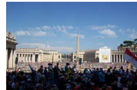
Szent Péter tér és a fiatalok

Lelkiekben gazdagodva és új barátságokkal tértünk haza.