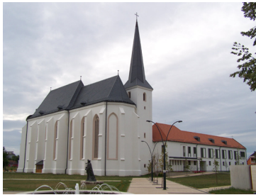
A Nyírbátori Minorita Templom és Lelkigyakorlatos Ház.